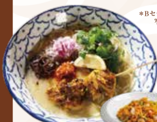
YAKITORI CHICKEN WHITE BROTH RAMEN チキンサテとレモンの 鶏白湯ラーメンセット