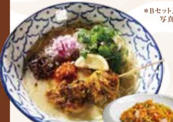
YAKITORI CHICKEN WHITE BROTH RAMEN チキンサテとレモンの 鶏白湯ラーメンセット