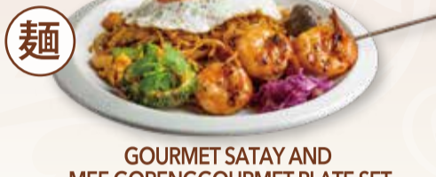
GOURMET SATAY AND MEE GORENG GOURMET PLATE SET