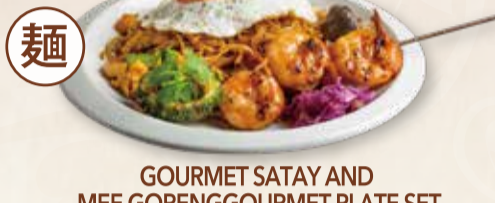
GOURMET SATAY AND MEE GORENG GOURMET PLATE SET