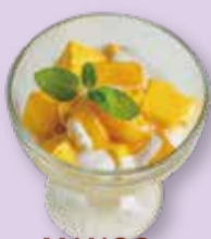
MANGO PUDDING マンゴープリン