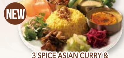
3 SPICE ASIAN CURRY & DELI GOURMET PLATE SET スパイスアジアンカレー 3種 & デリのグルメプレートセット