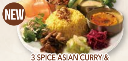
3 SPICE ASIAN CURRY & DELI GOURMET PLATE SET スパイスアジアカレー 3種 & デリのグルメプレートセット