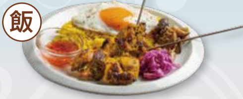
GOURMET PLATE OF CHICKEN SATAY