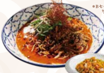
DRAGON SPICY CHICKEN DANDAN NOODLES ドラゴンスパイシー 鶏白湯坦々麺セット