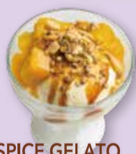
SPICE GELATO CARAMEL DUKKAH スパイスジェラート キャラメルデュカ