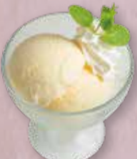
VANILLA ICE バニラアイス