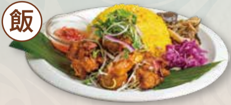
GOURMET PLATE OF FRIED CHICKEN