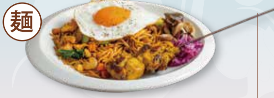
CHICKEN SATAY AND MEE GORENG GOURMET PLATE SET