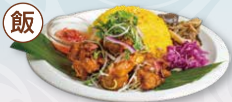
GOURMET PLATE OF FRIED CHICKEN