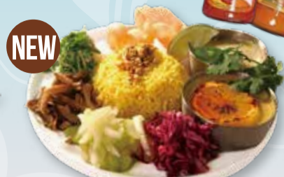
2 SPICE ASIAN CURRY & DELI GOURMET PLATE SET スパイスアジアンカレー 2種 & デリのグルメプレートセット

・焼きレモンチキンカレー・ビーフキーマカレー ・海老のグリーンカレー お好みのカレー 2種をお選びください