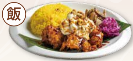
GOURMET PLATE OF FRIED CHICKEN