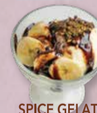
SPICE GELATO CHOCOLATE BANANA スパイスジェラート チョコバナナ