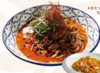
DRAGON SPICY CHICKEN DANDAN NOODLES ドラゴンスパイシー 鶏白湯坦々麺セット