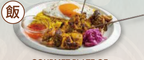
GOURMET PLATE OF CHICKEN SATAY