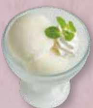
COCONUT ICE ココナッツアイス