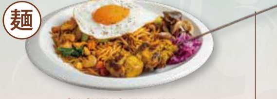
CHICKEN SATAY AND MEE GORENG GOURMET PLATE SET