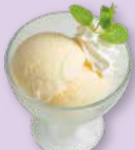
VANILLA ICE バニラアイス