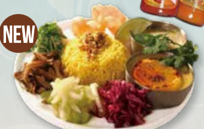
2 SPICE ASIAN CURRY & DELI GOURMET PLATE SET スパイスアジアカレー 2種 & デリのグルメプレートセット

・焼きレモンチキンカレー・ビーフキーマカレー ・海老のグリーンカレー お好みのカレー 2種をお選びください