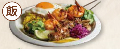
GOURMET SATAY SPECIAL PLATE