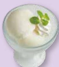
COCONUT ICE ココナッツアイス