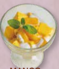
MANGO PUDDING マンゴープリン