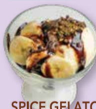
SPICE GELATO CHOCOLATE BANANA スパイスジェラート チョコバナナ