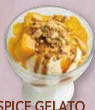
SPICE GELATO CARAMEL DUKKAH スパイスジェラート キャラメルデュカ